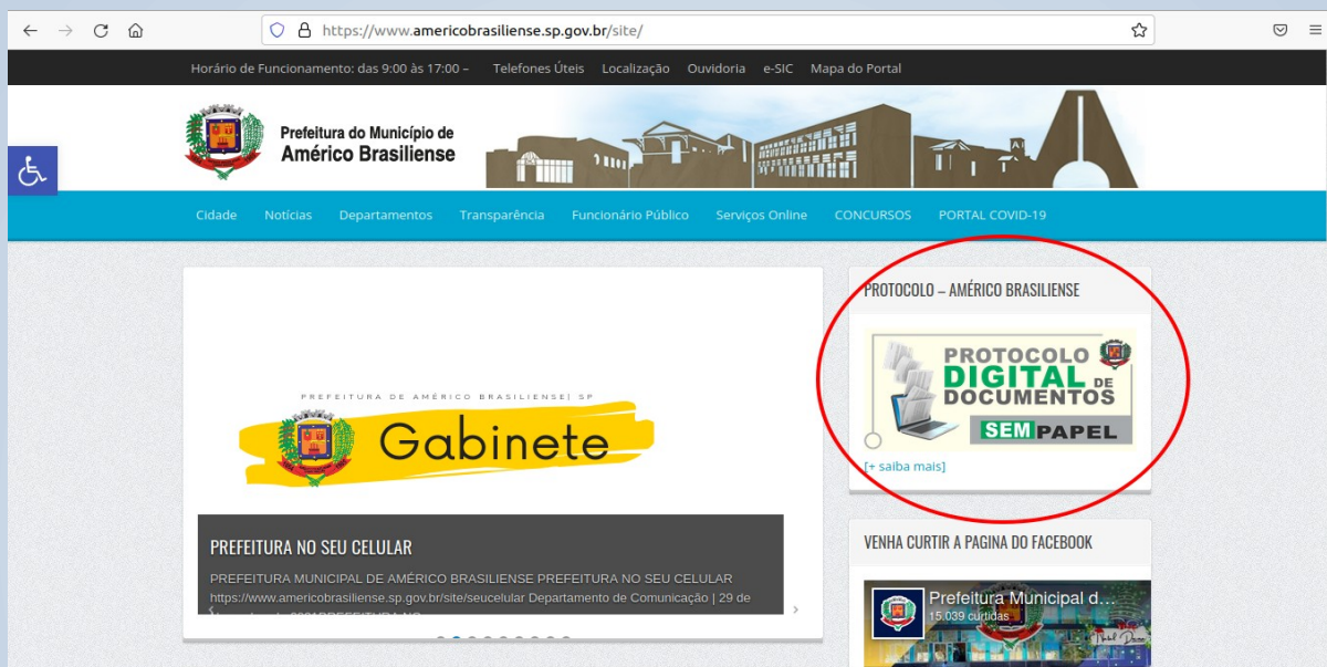
figura 1: demonstração do local de acesso a plataforma digital

Passo 1: acessar banner “Protocolo Digital de Documentos Sem Papel”, localizado no canto direito superior, conforme figura abaixo.