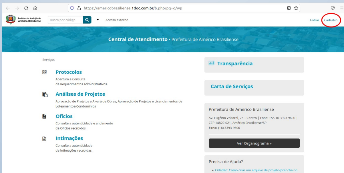
Figura 2: demonstração de acesso a tela de cadastro

Passo 2: Já dentro da plataforma digital, clicar no botão “Cadastro”, localizado no canto direito superior, conforme figura abaixo.